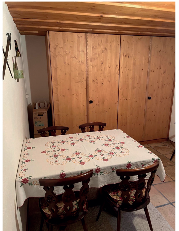
Fondue-Stübli oder Hobbyraum